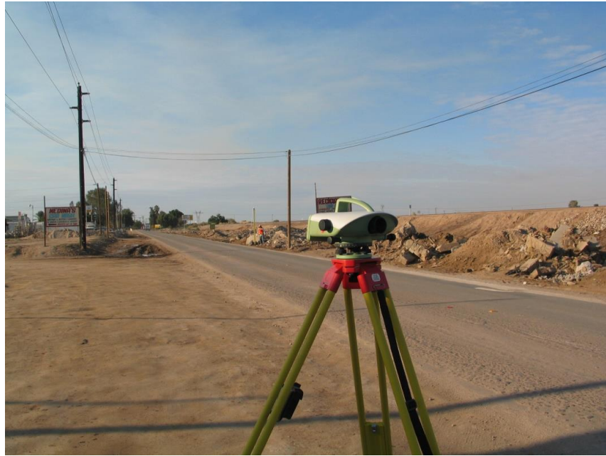
Figura 2. Nivel DNA-03